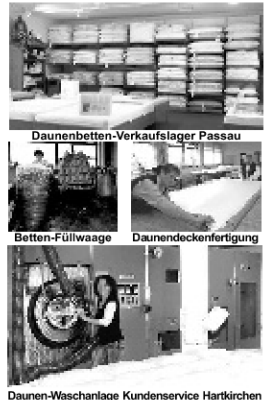
Daunen-Waschanlage Kundenservice Hartkirchen

Klassik-Daunenbetten für Ausgeschlafene Preis-Leistungsverhältnis - Spitze! Unsere grundsolden Klassik-Daunenbetten gefüllt mit halbweißen, europäischen Gänsedaunen und versehen mit besten Mako-Inlets gewährleisten für viele Jahre besten Komfort und Dauer-Stabilität! Premium-Daunenbetten für Schlafgenießer Anspruchsvolle Schläfer greifen gerne zu dieser hochwertigen Betten Sperlich Aussteuer-Qualität! Ausgefällt in jahrzehntelanger Erfahrung, gefüllt mit weissen, la, 100% Land-Gänsedaunen, bezogen mit edlen, farbigen Mako-Einschütten! Kammersteppbetten Exquisit - Luxus pur! Das Beste vom Besten! Feinste elegant-weiße Micro-Mako-Batiste in bestechender Verarbeitung! Eingeteilt in 3 Wärmegruppen und stets gefüllt mit dem Besten, was der Daunenmarkt bietet: Reiner, weiser, kostbarer 100% Gänse-Bauernflaum aus Freilandhaltung! Kopfkissen und Schlummerkissen Jeder hat seinen eigenen Kopf! Genau so vielfältig ist das Angebot von Kissen in allen Größen und Variationen bei Betten Sperlich! Vom robusten Kopfkissen über das Nackenkissen bis zum luxuriösem Trio-Daunenpolster! Unser Betten-Reinigungs-Service Wir sind auch nach dem Kauf für Sie da und bieten Daunen-Vollwäsche, Bettenumarbeitungen, Neubeziehen und Riesenauswahl an Bett-Inlets!