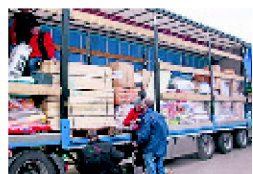
Der voll beladene Hilfstransporter aus Pocking.

Auch das TV-Team von Vox wird wieder mit vor Ort sein, die mit dem Sternenhof eine neue Serie für die beliebte Reihe „Hundkatzenmaus“ drehen. Der Ausstrahlungstermin ist im Januar und im Februar.